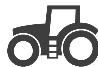
Traktor ab 150 PS