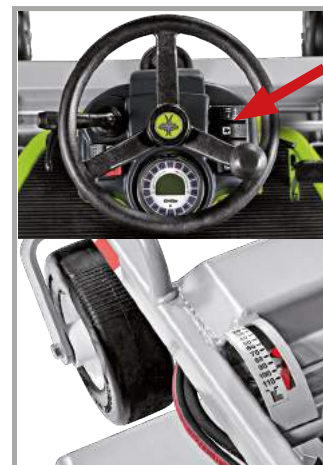
hydraulische Schnitthöhen- Schnellverstellung (stufenlos)

FD 13.09 ist mit einem extrem robusten Front-Mähdeck mit Kardantrieb und Winkelgetrieben ausgerüstet. Hydraulische Zapfwellenkupplung mit integrierter Messerbremse, die durch Druckknopf betätigt wird, dies gewährleistet Zuverlässigkeit und Langlebigkeit.