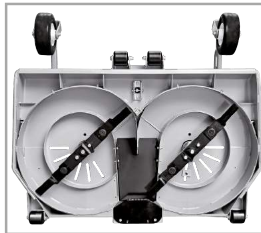
Serienmäßig Mulching Kit auf den Mähdecks mit Sammeln