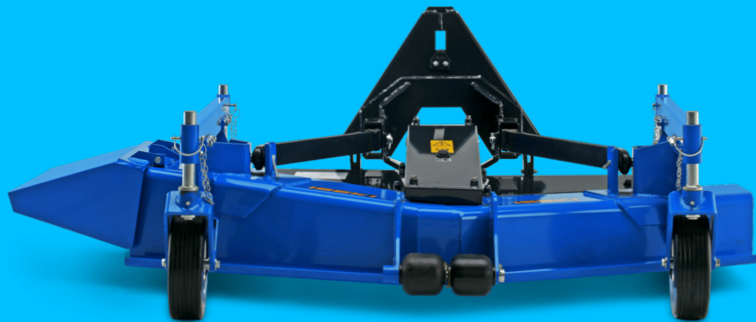
FM 160 PRO-S