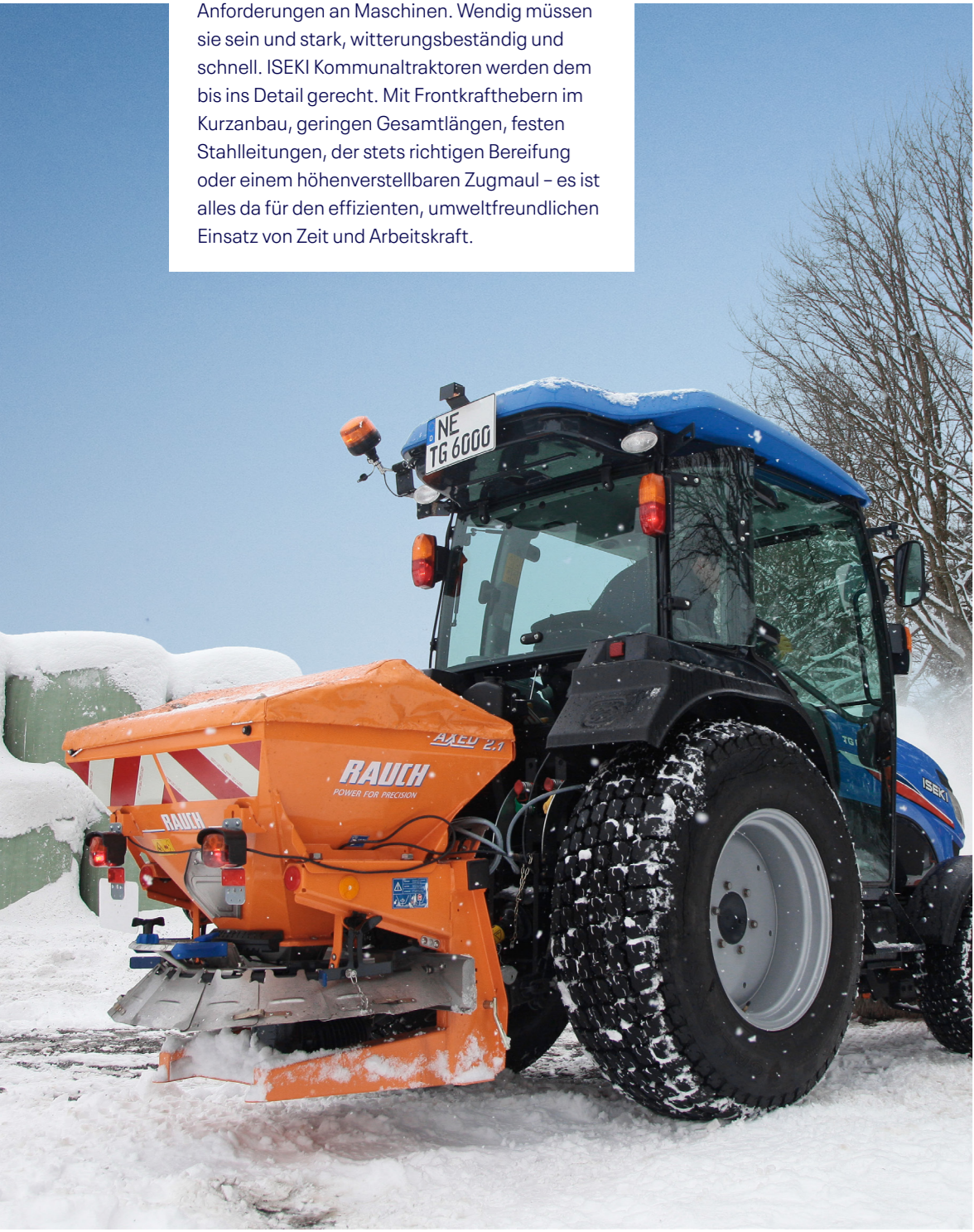
Mehr Sicherheit durch gleichmäßige Verteilung von Streugut in der kalten Jahreszeit.

Kommunaltauglichkeit auf 4 Rädern Alltag in Kommunen und Städten stellt höchste Anforderungen an Maschinen. Wendig müssen sie sein und stark, witterungsbeständig und schnell. ISEKI Kommunaltraktoren werden dem bis ins Detail gerecht. Mit Frontkrafthebern im Kurzanbau, geringen Gesamtlängen, festen Stahlleitungen, der stets richtigen Bereifung oder einem höhenverstellbaren Zugmaul – es ist alles da für den effizienten, umweltfreundlichen Einsatz von Zeit und Arbeitskraft.