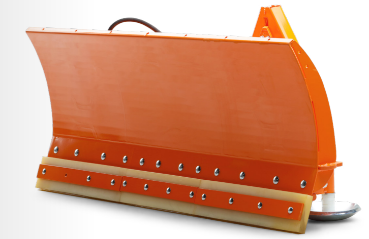
Eine von vielen Schneeschild-Optionen: von 1,30 bis 2,0 m; in verschiedenen Ausführungen