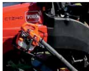
Halterung für Gebläse/Werkzeug