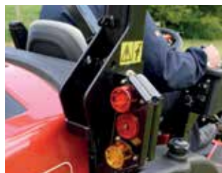
LED-Scheinwerfer mit Bremslichtern