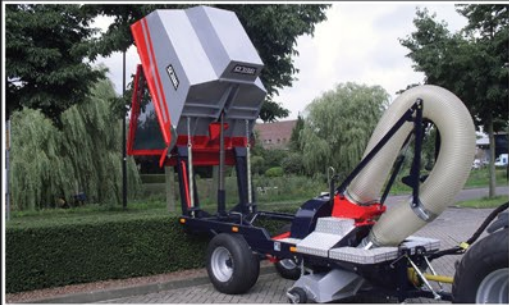
2.00 m Hochkipper