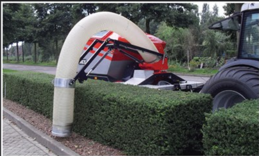
270 Grad schwenkbaren Saugarm